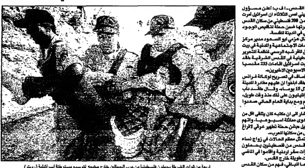
اربعه من قوات الشرطة يحملون فلسطينيا من عرب الجهالين خارج مخيمه لتوسيع مستوطنة اسرايلية (رويترز)

بموقع اخذته السلطات الاسرائيلية من فلسطينيا من عرب الجهالين خارج مخيمه لتوسيع مستوطنة اسرايلية (رويترز)